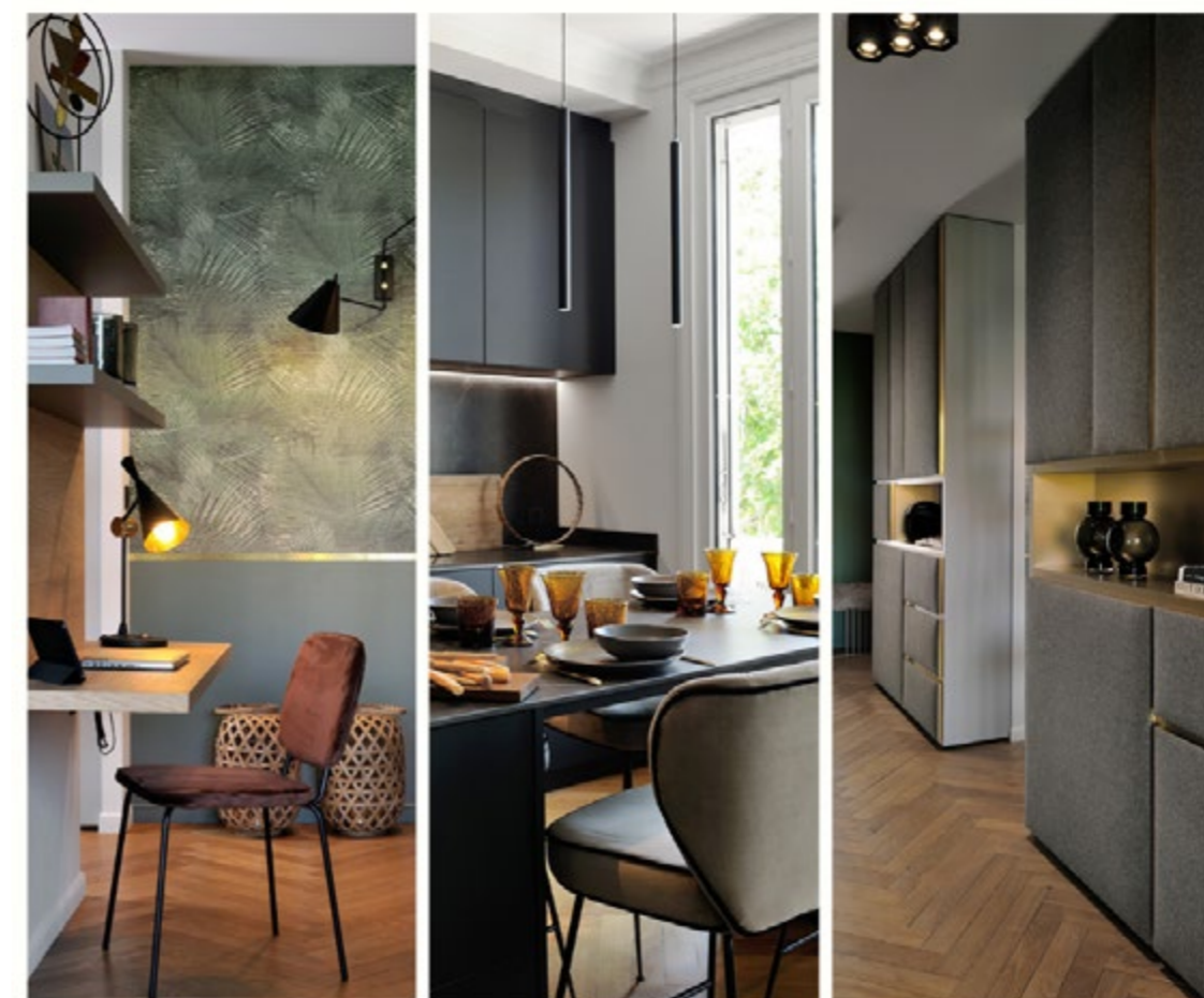
Projet de rénovation réalisé par Candice Bruny, architecte d'intérieur diplômée de CREAD Institut.