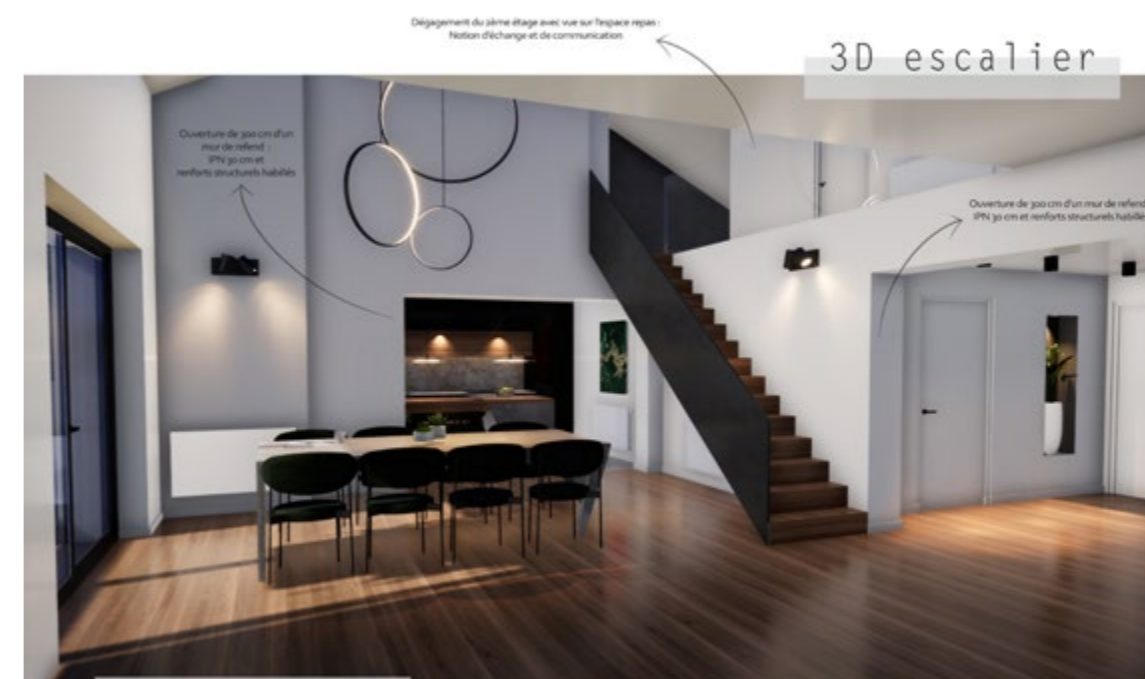
Vue 3D réalisée par Manon Teste, en 2ème année.

Titre d'Architecte d'Intérieur Designer Global certifié de niveau 7